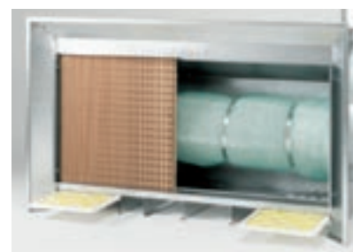
Leichte Zugänglichkeit sichert schnellen, problemlosen Wechsel der kostengünstigen Filter.