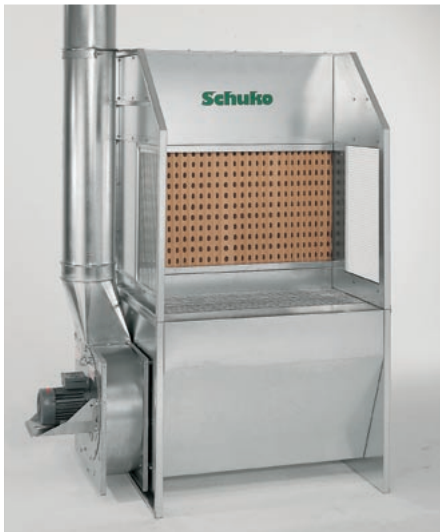
Das ideale Gerät für die Lacknebel- und Dunstabsaugung.

■ Der Schuko SAUGBOY lässt Ihre Mitarbeiter nicht länger im Nebel stehen. Das kompakte Gerät, speziell für Kleinteillackierungen entwickelt, bringt Schuko-Leistung zum günstigen Preis. Durch die geringen Außenmaße und den separierbaren Ventilator passt es sich fast allen räumlichen Gegebenheiten an. Große Seitenflächen aus Sicherheitsglas sorgen für guten Lichteinfall auf die zu bearbeitenden Teile.