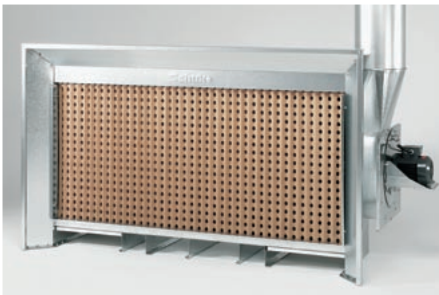
Solide Kompaktbauweise mit geringer Bautiefe – genau richtig für kleine Räume und Werkstätten.

■ Beim Schuko FARBMAX ist nicht nur der Preis heiß. Denn zu den knallhart kalkulierten Konditionen erhalten Sie die bewährte hohe Schuko-Produktqualität. Selbst wenn Sie nur gelegentlich Spritzarbeiten ausführen, gibt es jetzt keinen Grund mehr, aus Kosten- oder Platzgründen auf eine Farbnebelabsaugwand zu verzichten. Ihre Werkstatt, Ihre Mitarbeiter, Ihre Nachbarn und Ihre eigene Gesundheit werden es Ihnen danken.